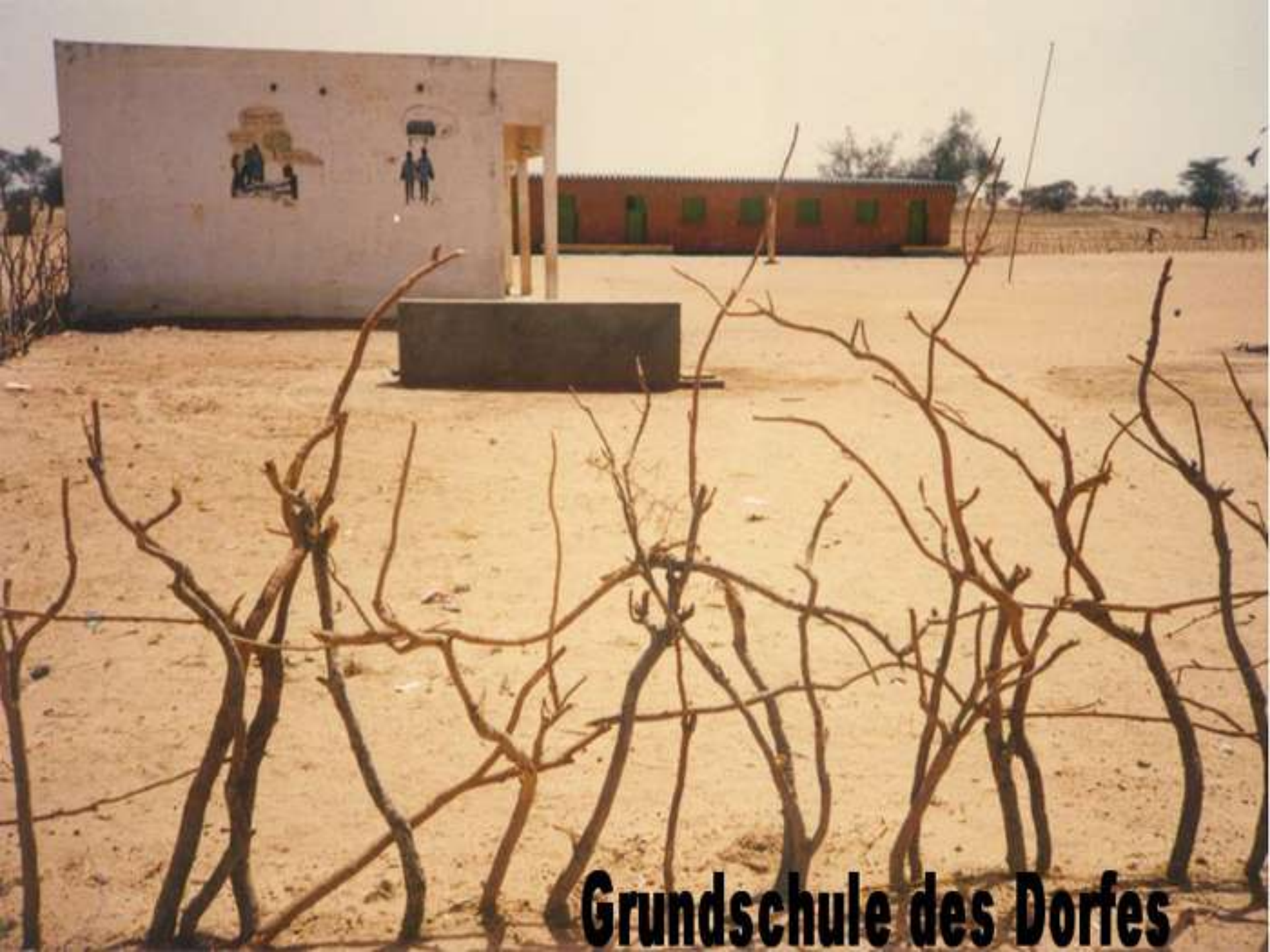
Grundschule des Dorfes