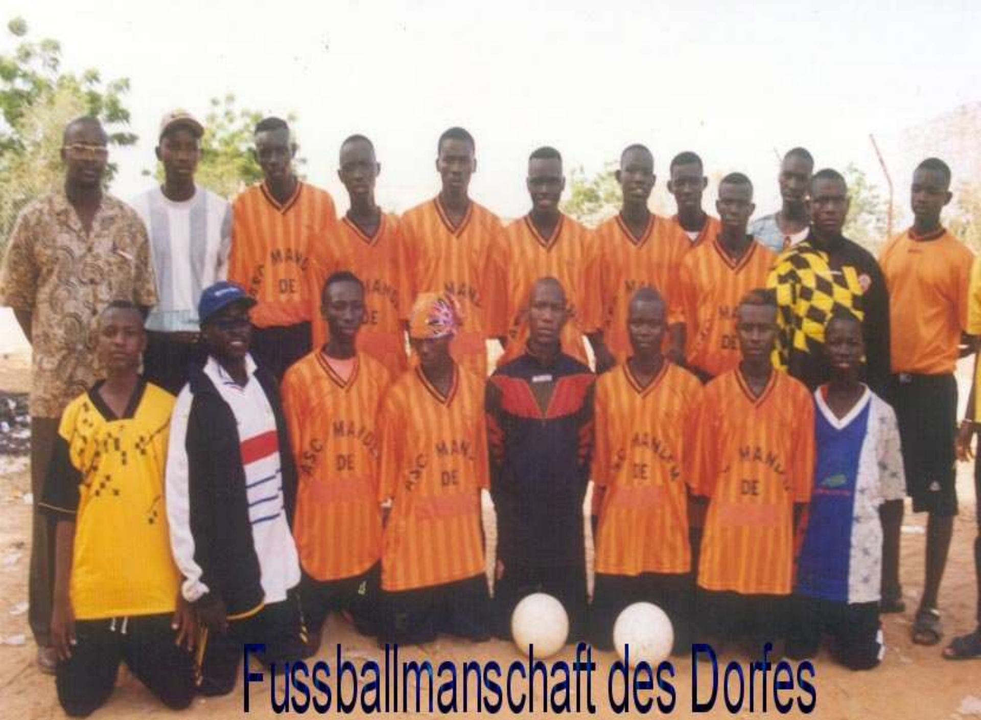
Fussballmanschaft des Dorfes