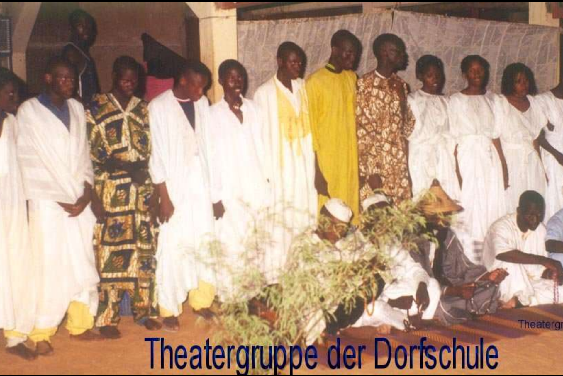
Theatergruppe der Dorfschule