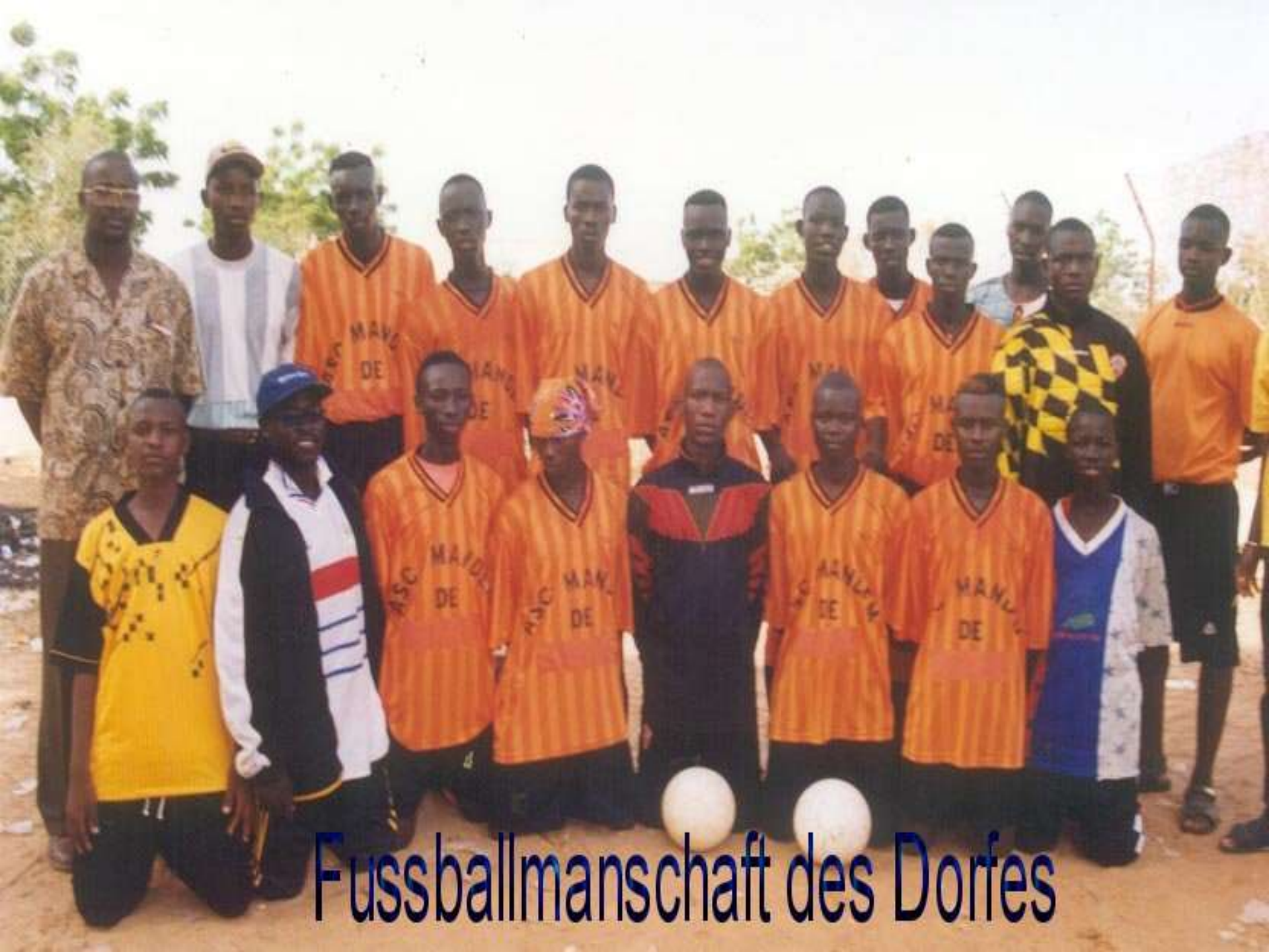
Fussballmanschaft des Dorfes